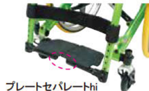
プレートセパレートhi