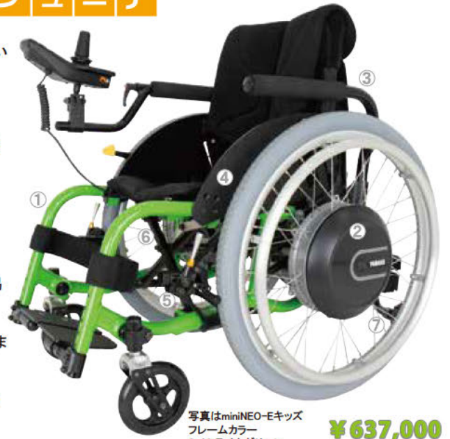
写真はminiNEO-Eキッズ フレームカラー S-02 ライムグリーン