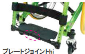
プレートジョイントhi

左右のフットレストを連結した「プレートジョイントhi」と、左右別々に折り上げられる「プレートセパレートhi」をラインナップしています。