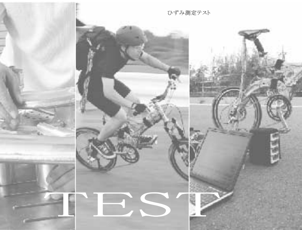
ひずみ測定テスト

カラーオーダーシステムにより、お選びいただけるカラーバリエーションは70色以上。詳細は、インターネットで下記URLにアクセス、または「オーエックスエンジニアリング」で検索してアクセスしてください。 http://www.oxgroup.co.jp/